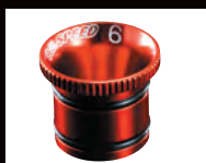
(“O” リング 2個付)